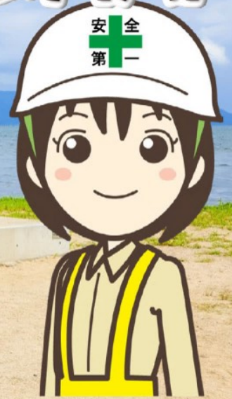
大会非公式セーフティパートナー 「まもりちゃん」