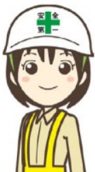
大会非公式セーフティパートナー 「まもりちゃん」

誘導スタッフ、警備が待機しています。 危険を伴う歩行は失格の対象となります。 必ず、誘導スタッフの指示に従ってください。