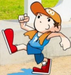
大会公式キャラクター 「いっぽくん」